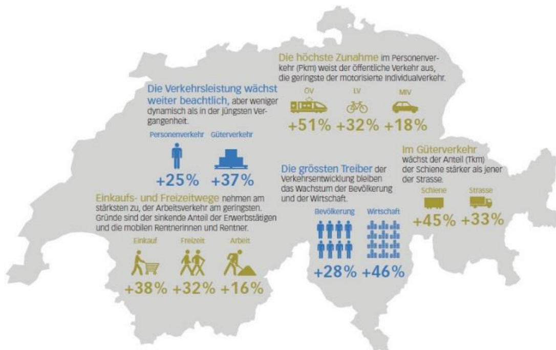
Abbildung 1: Überblick Entwicklung zentraler Kenngrössen 2010 bis 2040 (Referenzszenario)

Es wird nicht möglich sein, das grosse Verkehrswachstum alleine mit Ausbauten zu bewältigen, weil Ausbauten in dicht besiedelten Gebieten an Grenzen stossen, viel Zeit benötigen und teuer sowie auf den verbleibenden naturnahen Flächen unerwünscht sind. Der Bund strebt deshalb an, die bestehenden Infrastrukturen optimaler zu nutzen. Dafür vorgesehen sind z. B. die teilweise Umnutzung von